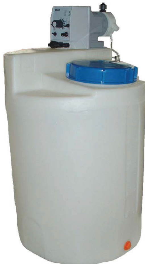
Dozirna postaja DP